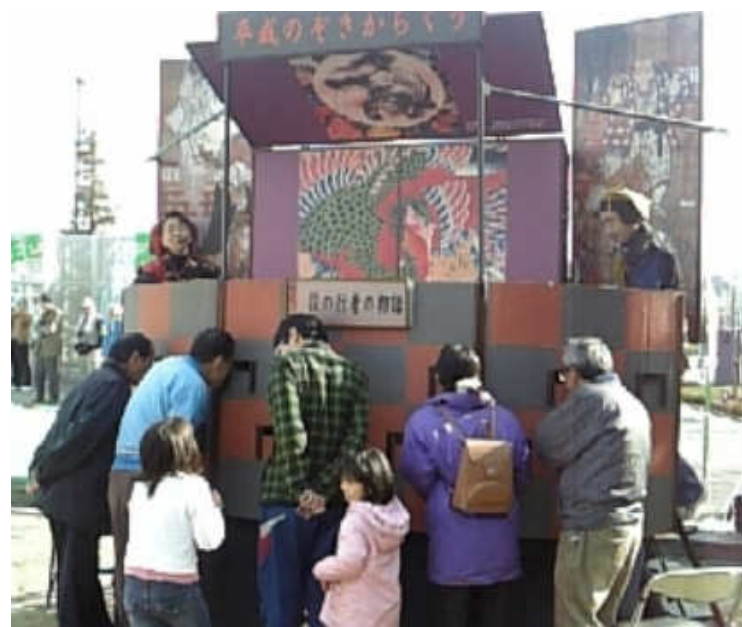
平成のぞきからくり(みどり生き生きのお生き生き体験フェアにて)