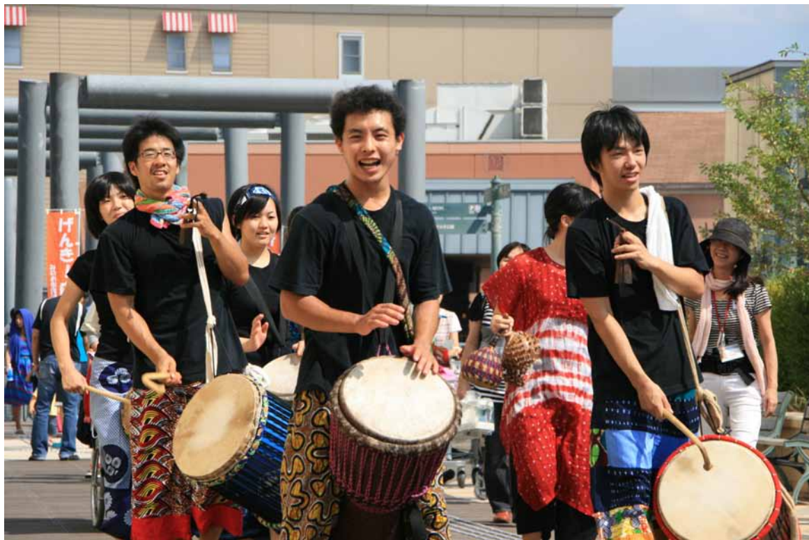
ヴィンラをねり歩くジェンバサークルTalibe 9月19日NPOフェスタにて