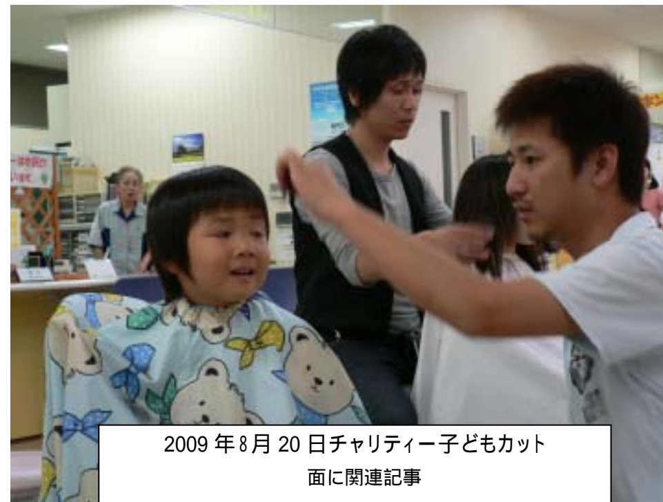
2009年8月20日チャリティー子どもカッ ト面に関連記事